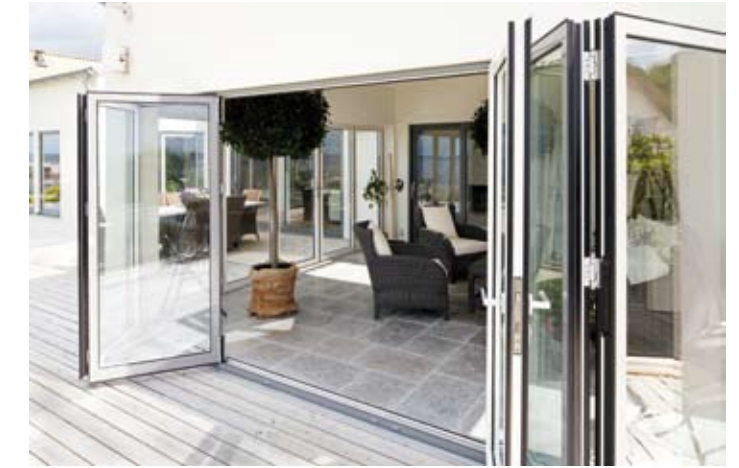
Uterummet är på 20 kvadratmeter och blir en förlängning på huset.

på hela 20 kvadratmeter. De stora glasörrarna som går längst med hela sidorna av uterummet går att öppna upp, vilket är extra tacksamt varma somrardagar. Men uterummet blir en härligt förlängning av huset oavsett om det är öppet eller stängt.