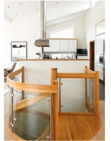
Trappan som går ner till undervåningen är noggrant utplacerad av en arkitekt.

att det var mer praktiskt för dem att få allt samlat under ett och samma tak. Willa Nordic var den första leverantören som de gick till och det kändes bra på en gång.