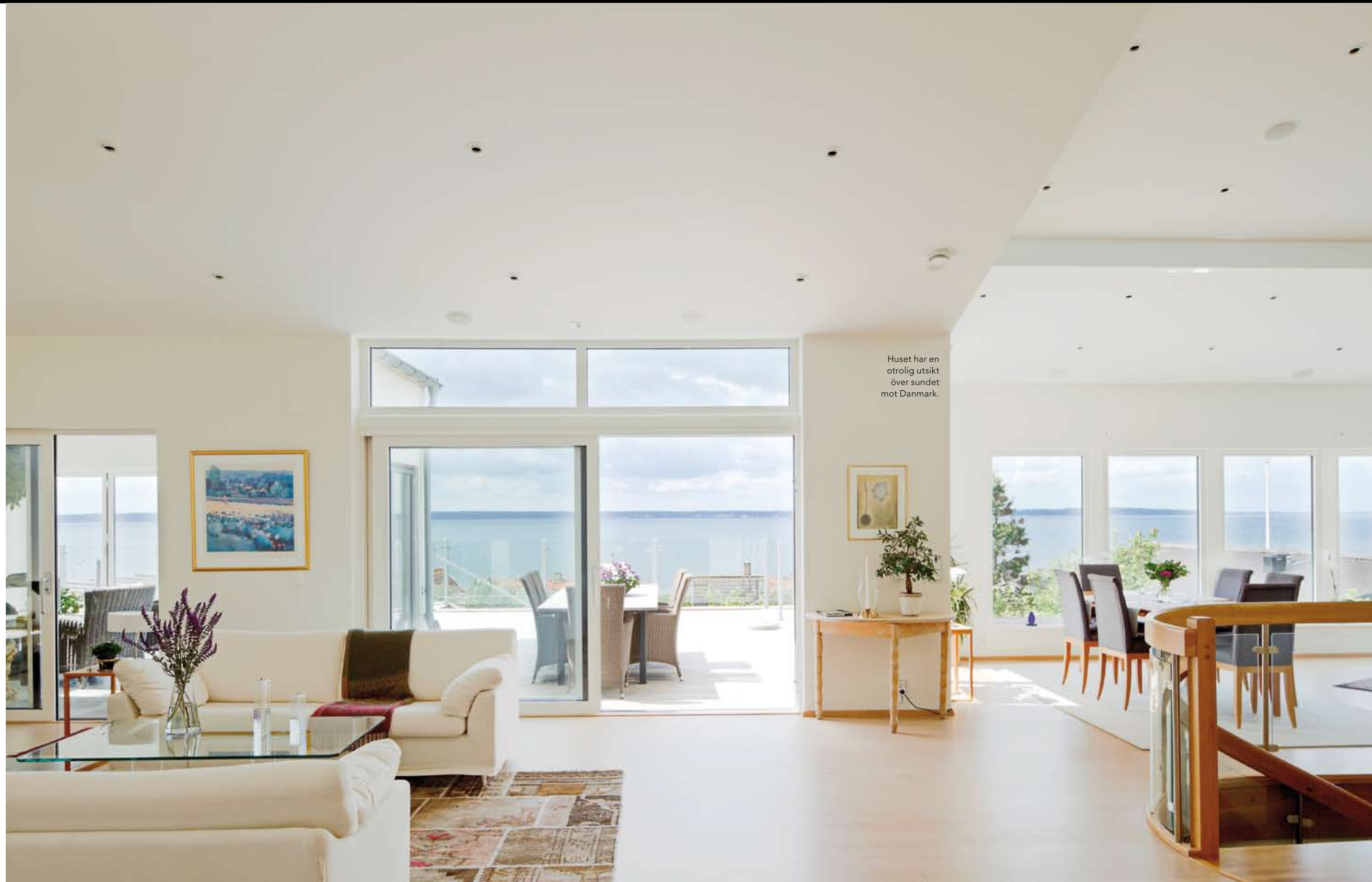
Huset har en otrolig utsikt över sundet mot Danmark.

På övervåningen har man även tillgång till ett stort härligt uterum. Det sitter ihop med huset och är >