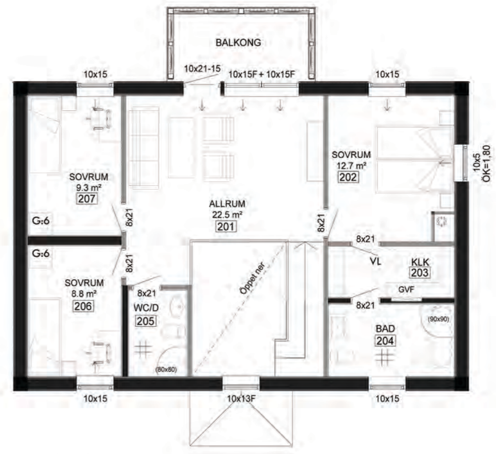
ÖVERVÅNING INV. AREA: 85,5 m 2 (INKL. ÖPPET NER OCH TRAPPA)